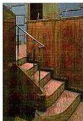
VASEMMALLA | Portaat puhujakorokkeelle.

kansanedustajalla on monipuolinen toimenkuva